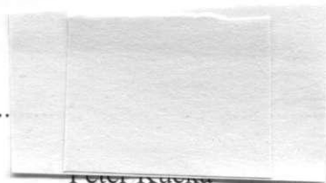
..... riaditeľ ZUŠ Nižná